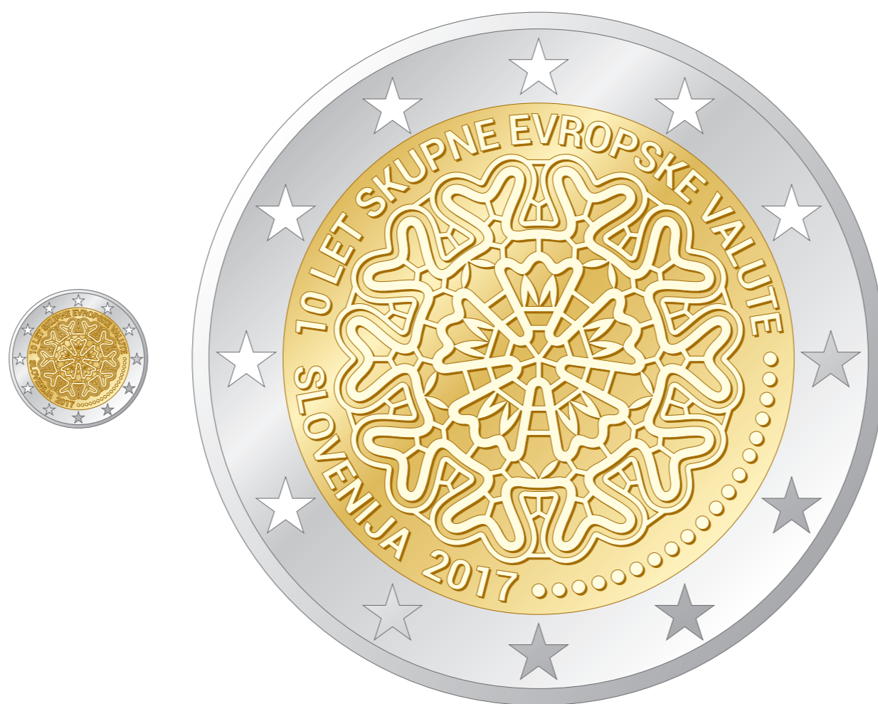
Spominski kovanec za 2 eura: barvni prikaz M 1:1 in 1:5