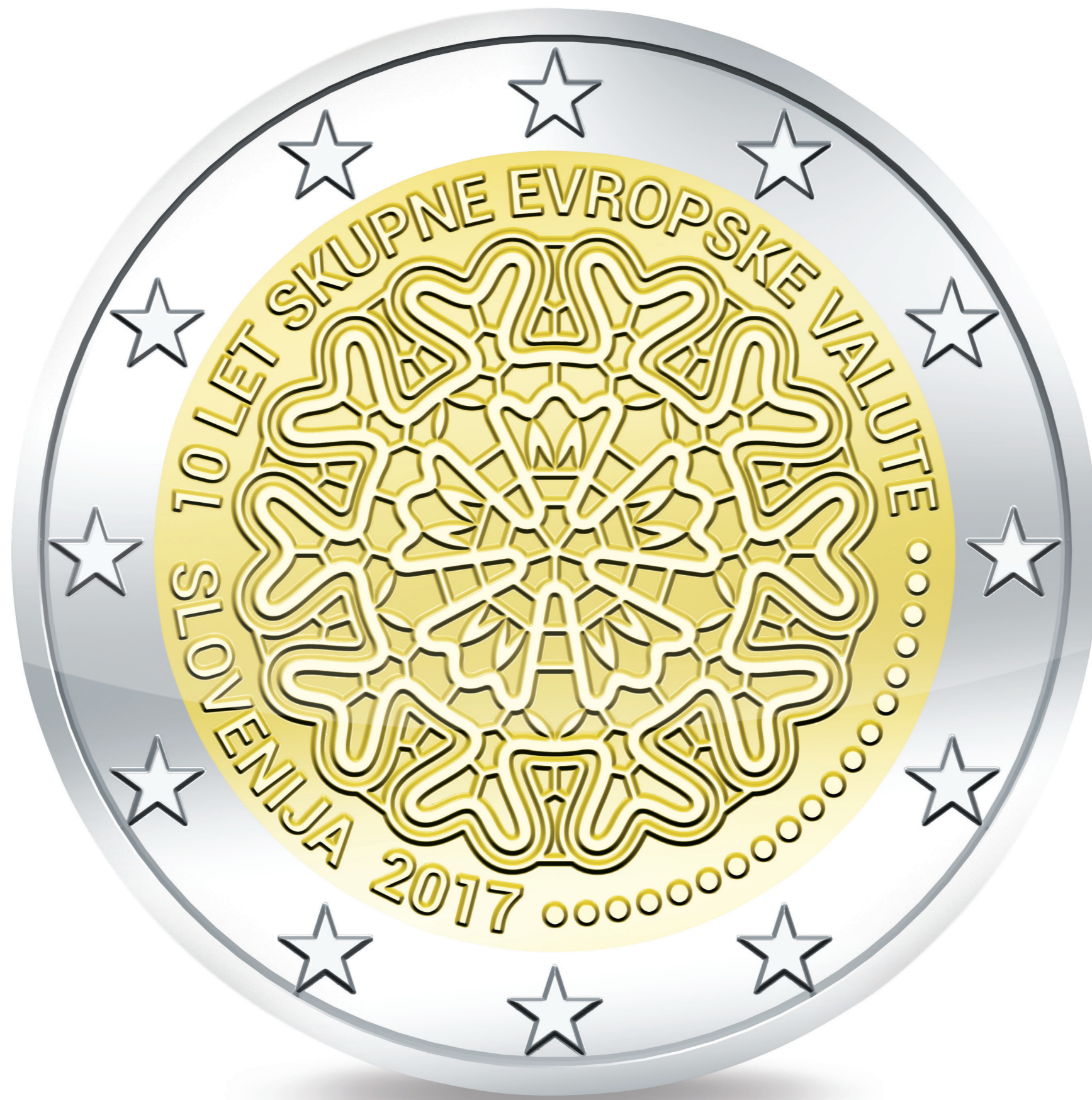
Spominski kovanec za 2 eura: 3D pogled